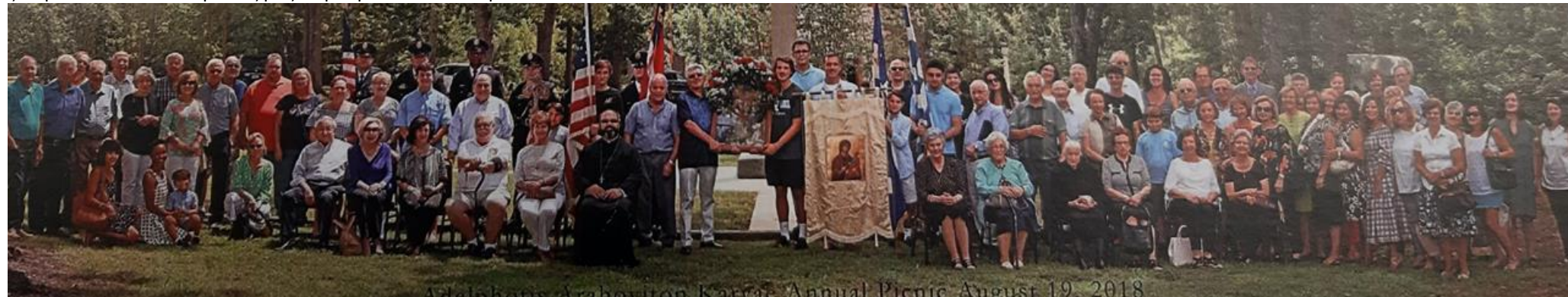
Αναμνηστική φωτογραφία των παρισταμένων συμπατριωτών μας στο πανηγύρι στις 19 Αυγούστου του 2018 στο πάρκο «Καρυές» της Γκαστόνια

Η πανδημία δυστυχώς έχει κτυπήσει με σφοδρότητα τις Η.Π.Α. και γι αυτό τον λόγο για πρώτη φορά δεν πραγματοποιήθηκε το ετήσιο πανηγύρι της παλαιότερης Καρυατικής Αδελφότητας. Ωστόσο μας απεστάλει το Ετήσιο Λεύκωμα 2019, από το οποίο και δημοσιεύουμε φωτογραφία από την εκδήλωση του 2018. Ευχόμαστε το 2021 τα προβλήματα να ξεπεραστούν και οι πατριώτες μας να μπορέσουν να ανταμώσουν πάλι.